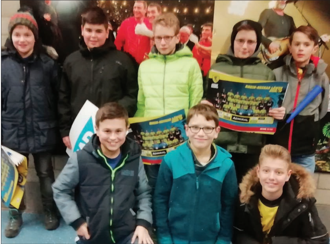
Die männliche D-Jugend in Mannheim bei den Rhein-Neckar-Löwen

Ende Januar geht es mit den neu zusammengestellten Staffeln weiter. Dort spie-