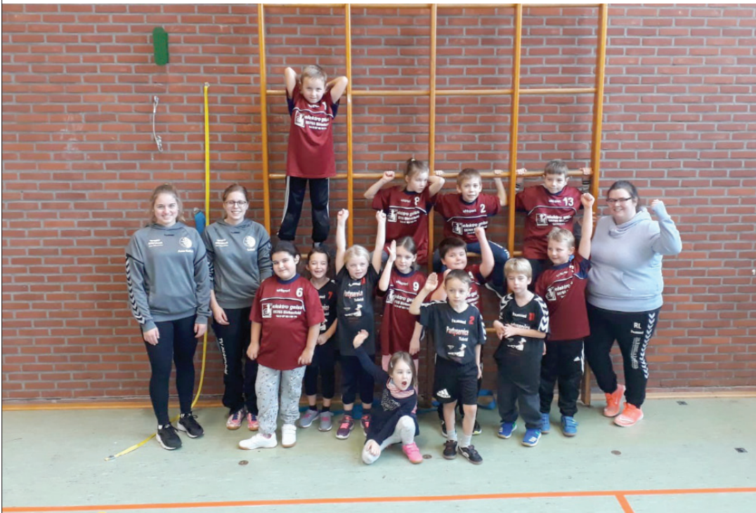
Die Minis der Handballer mit ihren Trainerinnen

Wir traten mit zwei Mannschaften, eine mit