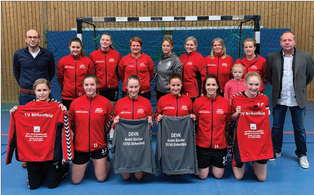
Die 1. Damen mit ihren Sponsoren