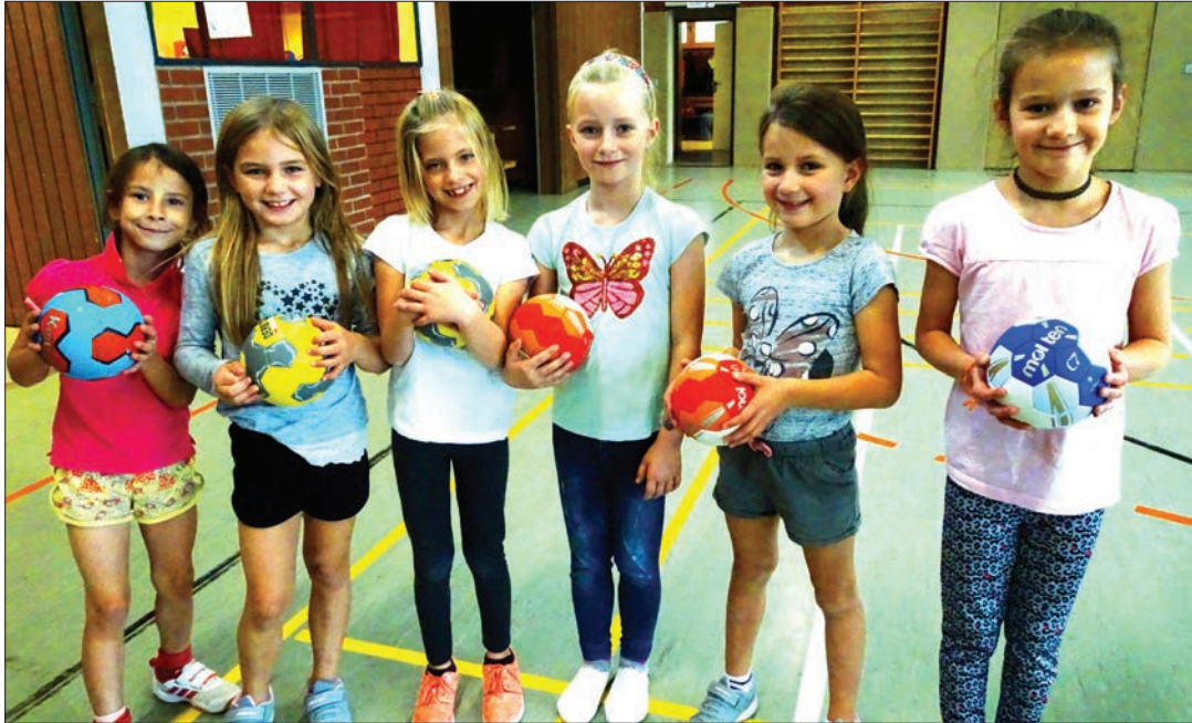
Viel Spaß hatten die Handballerinnen beim Grundschulaktionstag des TVB

Hierzu wurden die 4 Schulklassen zunächst in 2 Gruppen zu 40 -45 Schülern aufge-